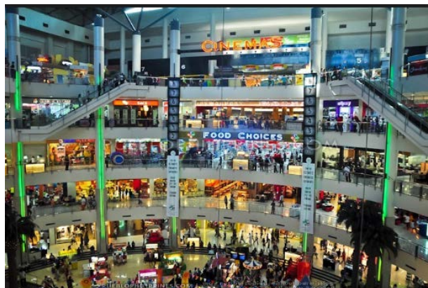
Fort Bonifacio Shopping Mall

固定公衆網事業に関しては既にその限界を感じていたものですから、若い新たな責任者が張り切って地方電話会社の買収や、カード発行事業、固定インターネット事業等種々投資・出資項目を役員会への事前説明として提案してきましたが、殆ど拒否せざるを得ないと思われ、実施後の撤退策を一緒に提案すべきと何度か対立せざるを得ない状況がありました。